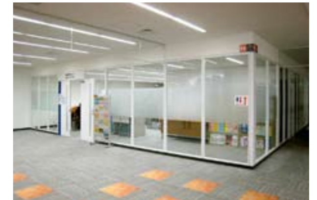
消費生活に関する問い合わせや相談を受け、必要な情報提供等を行う浦和消費生活センター。市民活動サポートセンターと同じ9階にある。