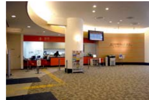
各種発表会、音楽練習、講演・会議などが行えるスペースが多く用意されている10階の浦和コミュニティセンター。

コムナーレのある浦和駅東口駅前再開発ビル(正式名称ストリームビル)の夜景。画面左の大きな窓上部にはコムナーレのマークが見える。