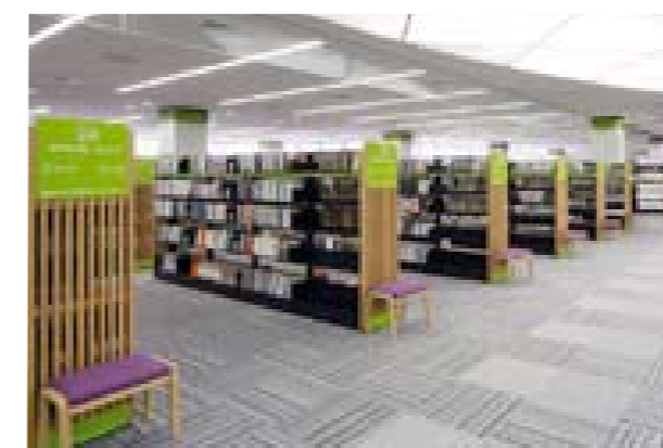
図書25万冊、CD1万枚の蔵書数を誇る、8階の中央図書館。