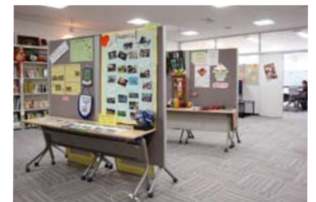
市民活動サポートセンターと同じ9階にある、国際化の推進や在住外国人と市民の交流の場として、また国際関連団体の活動拠点としてつくられた国際交流センター。