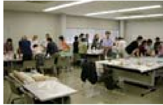
何度も集まってワークショップ活動を行い市民活動サポートセンターへの理解を深めるとともに、協働の体制をつくりあげていった。